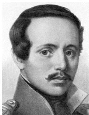
Михаил Юрьевич Лермонтов (1814–1841)