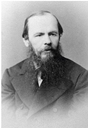
Фёдор Миха́йлович Достоевский (1821–1881)

Русский писатель, мыслитель, философ и публицист.