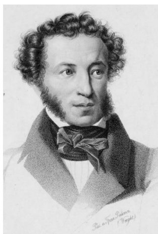
Алекса́ндр Серге́евич Пу́шкин (1799–1837)

1. А. С. Пушкин. Роман «Евгений Онегин» (общее представление), стихотворения: «Я помню чудное мгновенье...», «Пророк», «Я вас любил: любовь еще, быть может...», «Зимнее утро», «Я памятник себе воздвиг нерукотворный...».