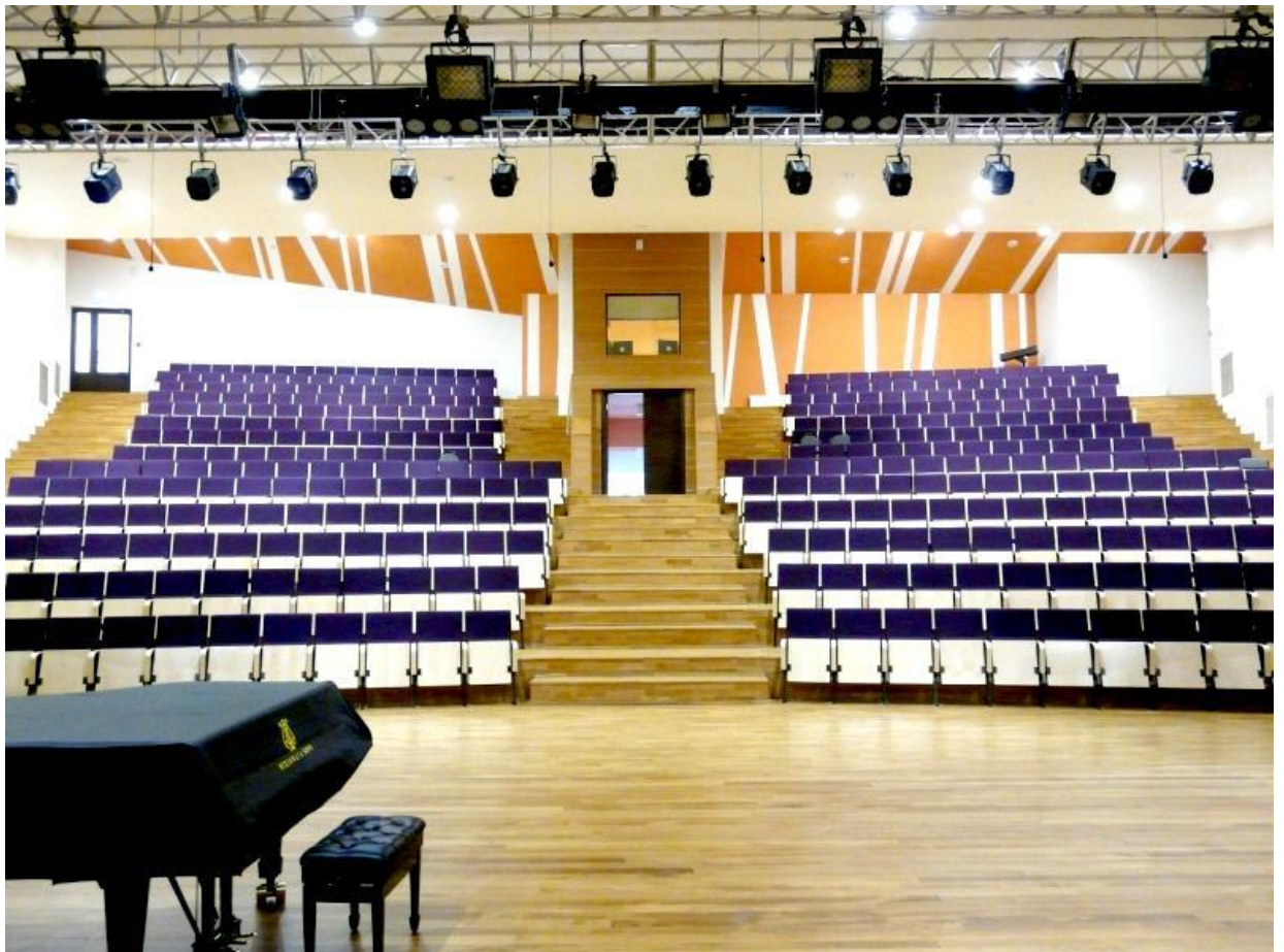
Малый концертный зал на 88 мест, в котором имеется орган марки «Johannes», два концертных рояля марок «Bechtein» и «Steinway&Sons».